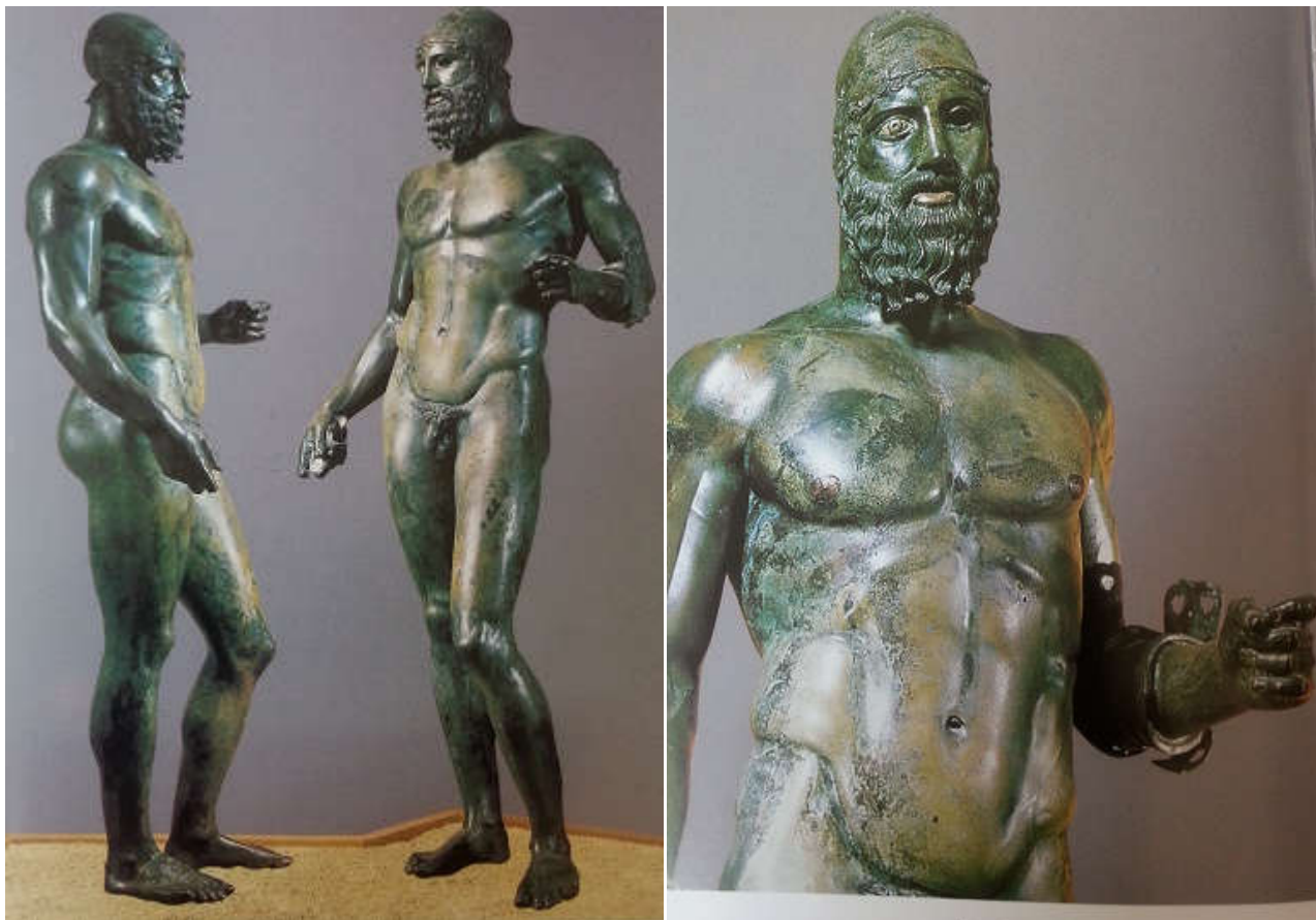
Fig. 4 Statua B

C. 1. La statua B presenta le medesime caratteristiche della statua A con qualche variazione nella testa e nella barba.