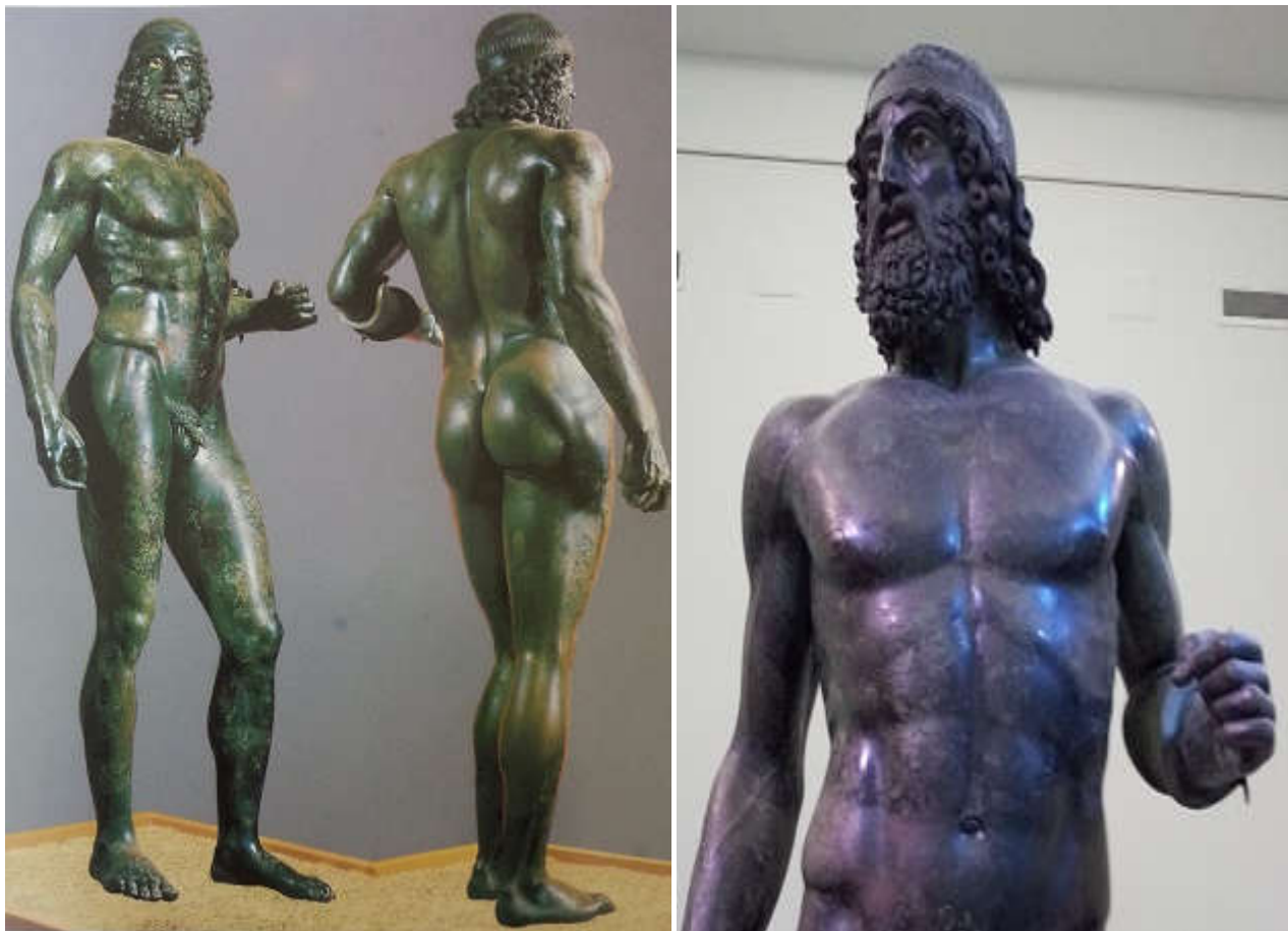
Fig. 2 Statua A